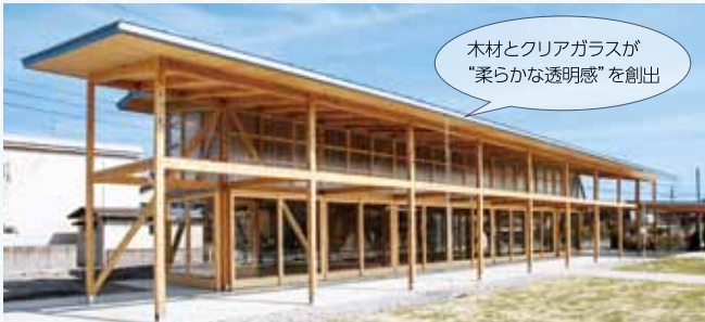
木材とクリアガラスが“柔らかな透明感”を創出

厨房設備や調理器具も完備した商業・交流スペース。マルシェなどのイベントにも多く使用され、鶴川地区の新たなにぎわい拠点となっています。最大5店舗の出店が可能で、新規開業のための“お試し開業”にもご利用いただけます。