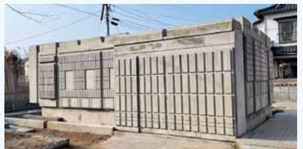
Kunisaki House/2022 Rachel Whiteread